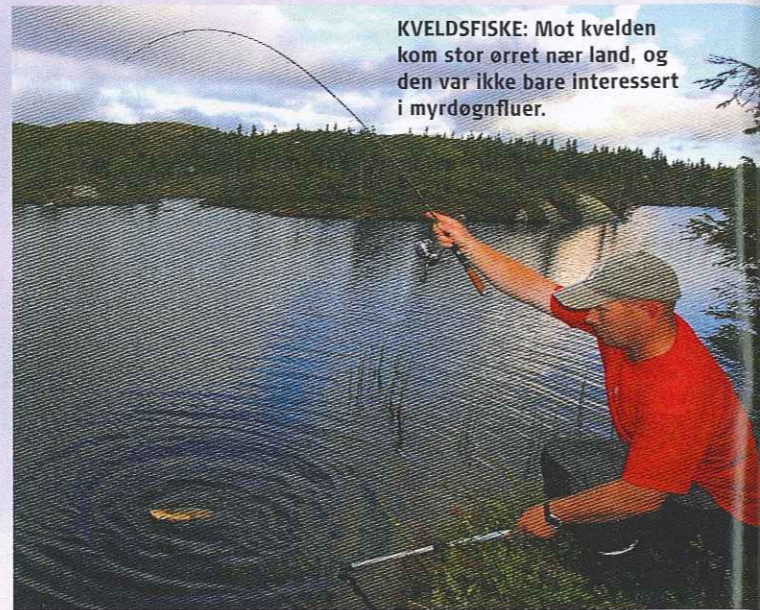
KVELDSFISKE: Mot kvelden kom stor ørret nær land, og den var ikke bare interessert i myrdøgnfluer.

Neste dag var grå, men mye varmere, mye på grunn av at vinden nesten hadde stilnet. Kun en mild bris strøk vannflata. Det viste insektene å sette