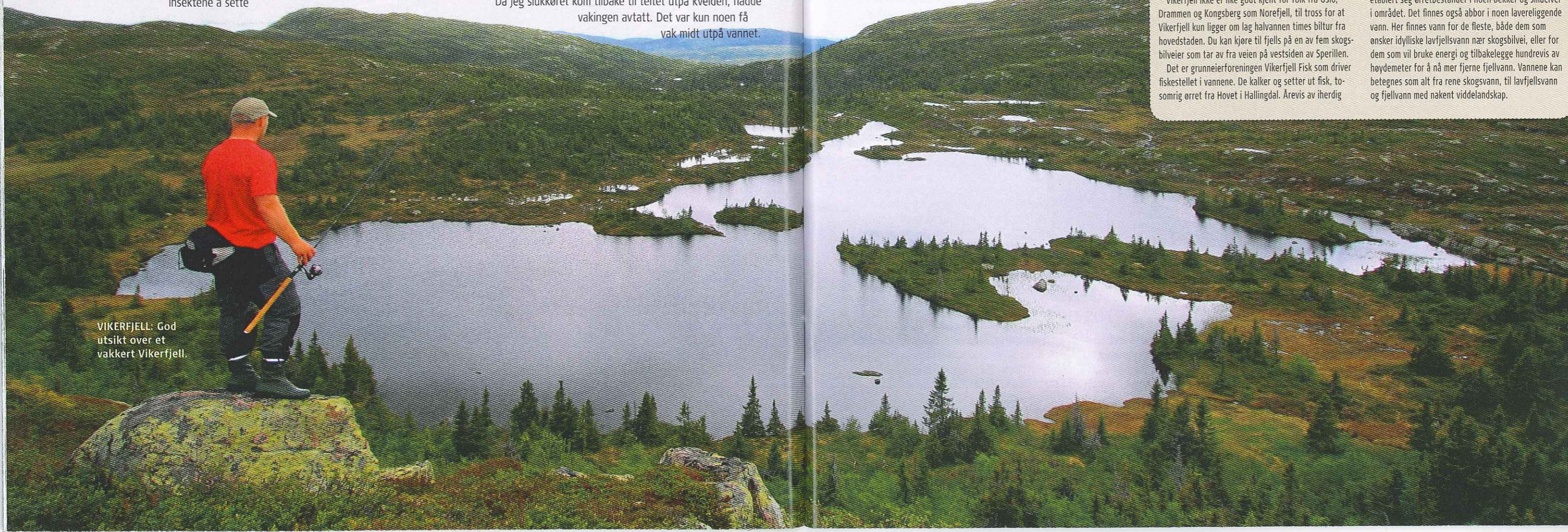
VIKERFJELL: God utsikt over et vakkert Vikerfjell.

kultivering har gitt resultater. I dag finnes et tjuetall vann med en meget god ørretbestand. I tillegg har det etablert seg ørretbestander i noen bekker og småelver i området. Det finnes også abbor i noen lavereliggende vann. Her finnes vann for de fleste, både dem som ønsker idylliske lavfjells vann nær skogsbilvei, eller for dem som vil bruke energi og tilbakelegge hundrevis av høydemeter for å nå mer fjerne fjellvann. Vannene kan betegnes som alt fra rene skogsvann, til lavfjells vann og fjellvann med nakent viddelandskap.